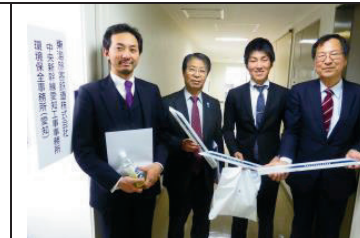
保守連合会派所属議員