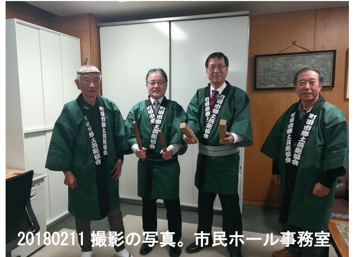
20180211 撮影の写真。市民ホール事務室

日本では、15歳から65歳未満の年齢に該当する世代が生産年齢人口と称されています。それ以外の世代は、逆の意味で「従属人口」や「被扶養人口」と称されています。果たして、この定義・説明に納得できる人がどれ程いるのでしょうか。むしろ、大きな社会的問題となっている課題は、40-50歳になった世代を70-80歳代が扶養しているという現実です。