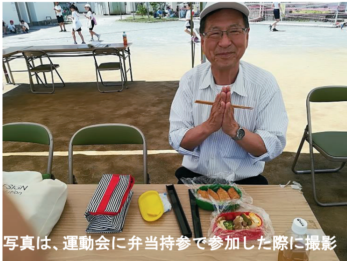
写真は、運動会に弁当持参で参加した際に撮影

読売新聞令和元年(2019年)6月1日朝刊は、「町田市中学生 給食試食会 市が5日分提供 利用率改善狙う」と記事を掲載しました。この記事では、どういう経過で中学校給食の無料体験の実施に至る行政判断があったかを一切記していません。昨年、町田市議会は「小学校給食と同じような中学校給食の実施を求める請願」を不採択としましたが、現行の委託給食弁当が不人気であり、一度も利用したことがない生徒の割合は80%に達しており、その改善は差し迫った事態でした。