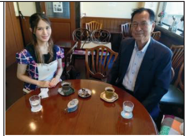
インターン生募集中