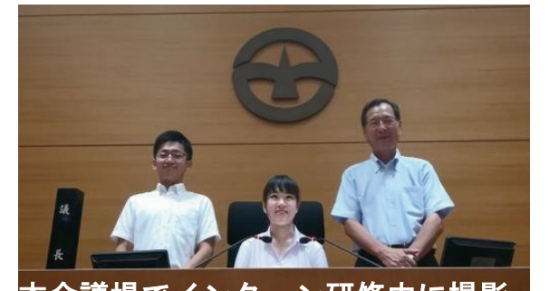
本会議場でインタビュー研修中に撮影

その調査の前に、同行援護人の拡充には、その手当てを増大することが最もシンプルなことですが、あえてその増大は求めませんでした。*その理由は、現実的にこの課題を提起し、対応施策が取り入れられる見込みがないからでした。資格者の取得費の費用負担 (全部、一部) を求めましたが、他市の例を調べるという範囲で質疑を終えました。