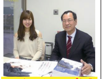
インタビュー好評