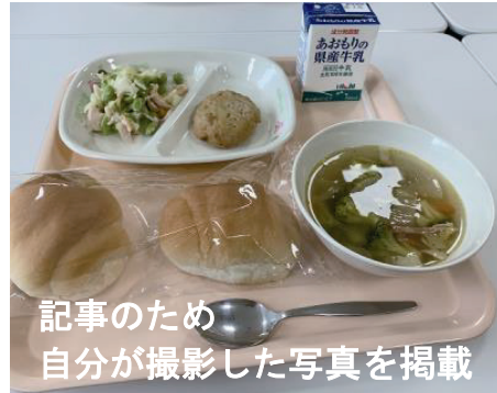
記事のため 自分が撮影した写真を掲載

「まちだパパママ給食クロストーク!!」と言うものに参加しました。町田市の《町田市民協働フェスティバル「まちカフェ!」10DAYS内イベント》の一環で実施されたもので、担当の市職員の方も参加されていました。実施方法は、今風にzoomを使用したもので、オンラインによる開催です。町田市の中学校給食の改善を求める団体が主催したもので、直近で、町田市長が旧来の方法を見直し、新たな方式の検討を町田学校給食問題協議会に諮問して、令和3年1月にその答申を受けるタイミングでの、開催は意義あるものでしょう。この団体は、個人の皆さんが連携して、町田市の中学校給食の改善を求めて運動してきたものですが、一般の運動が市政の転換につながる確かな例と思っています。