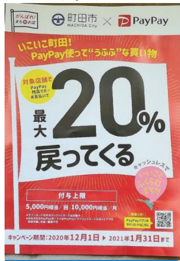
*町田市発行のチラシ

まずこのpp事業予算の歳入が、全額国費（約12億円）で賄われ、町田市は1円も使わずに実質11億5千万円を消費者に還元する費用とする事業となっています。国がキャッシュレス決済を推進するために実施する事業としての位置づけです。町田市は入札で業者を募集し、一番有利な条件を提示したpaypayを採用したわけです。聞くところによると、全国の自治体で80%ほどがpaypayを採用しているようです。また、この事業に参加した企業がpaypayに払う手数料は無料（キャンペーン分）であり、町田市内におけるキャッシュレス決済方法は、ますます、この、paypayに集中拡大するでしょう。