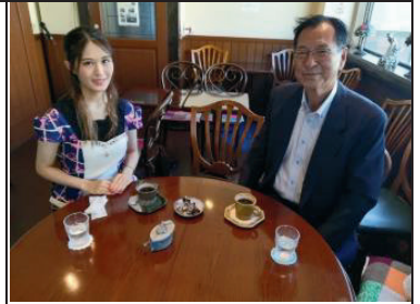
インターン生募集中