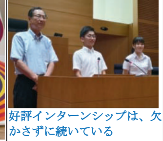
好評インターンシップは、欠かさずに続けている