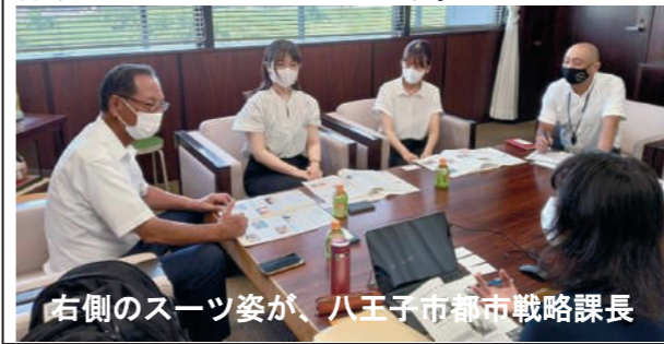
右側のスーツ姿が、八王子市都市戦略課長

そこで、質問の趣旨を、「町田市が中核市市長会のオブザーバーとして参加していることを、議会や市民のどのように広報したか」という点に置き、その拡大を求めることにしたのです。これは、明らかに自分の政治的な主張として後退するものですが、私自身は町田市が中核市を目指すことを求めてきたわけであり、かつ、町田市が中核市に係ることは良いことだと思っているためです。そこで、今後の重点をオブザーバー参加の活動内容をより幅広く広報を行い、市民自身が議論できる場を確保すべきだと思っています。