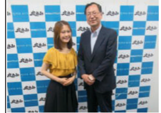
好評インターンシップは、第51期生を募集予定