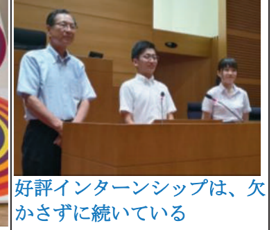
好評インターンシップは、欠かさずに続いている