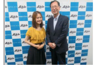
好評インターンシップは、第51期生を募集予定