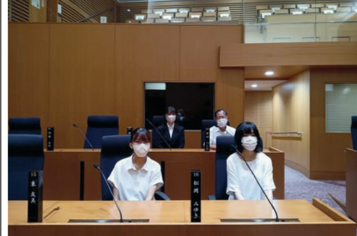
本会議場の議員席に着席し、撮影しました

委員(議員)からの決算質疑は金額、数値に対する質問が多くあり、私はその中でも特に気になった議題について取り上げようと思います。それは、いくつもの福祉施設の就労で障害者の方が月一円で働いている事です。市の担当者曰く、送迎費や昼食代は本人負担とされるとのことで、私はその給料だけで本当に障害者自身の権利が尊重される、自立した生活を送る事が出来るのだろうか疑問に思いました。何としてでもこの障害者の労働を取り巻く状況が好転することを期待します。