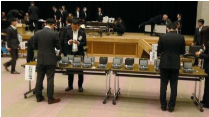
青森県六戸町で実施された電子投票を視察

投票用紙に手書きする方法を電子投票方式の投票に切り替えると、数を間違える例や、だれに投票したものか読み取れないという疑問票と言うものはゼロになります。電子投票の場合は、全部の候補者名をモニター画面に並べ、その中から選択して投票ボタンを押す方法になります。特定メーカーの機種で読込のデータがオーバーフローして電子投票機がストップし、投票が出来ない人が多数出た事故が発生し、岐阜県可児市で投票無効となった例があり、そのことが起因して現在は全部の自治体で休止しているものですが、改めて、このような状況を見ると、再スタートをする段階が来たのではないのでしょうか。