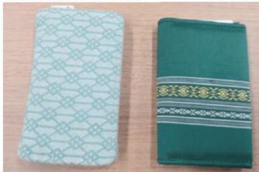
二つの名刺入れ、右が博多織、献上柄と言います。左が米沢織です。

担当職員の方で名刺入れが米沢織のものを持っていた方があり、私は博多織のものを持参していましたが、その博多織をご存じの方が一人もおられませんでした。国産繊維産業の衰退化を再確認しました。