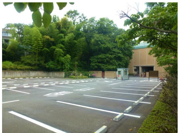
国際版画美術館の利用者が利用する芹が谷公園駐車場(開業時間前に撮影)。

この間、「この駐車場有料化は議会が決定した」と市職員が利用者に説明していることも許せないことで、私は本会議質疑の中で明らかにしました。行政側の提案で有料化が必要で、かつ、経費を収入が上回るとして提案したことで、やむなく議員は賛成したのだと経過を説明しました。早期に改善(元の無料に戻す)が必要だと思います。