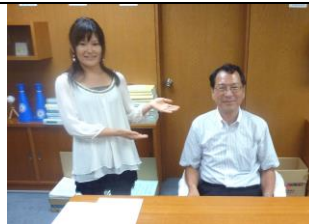
インタビュー生募集中