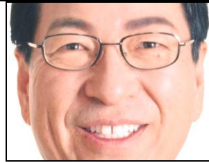
双方向の情報交流