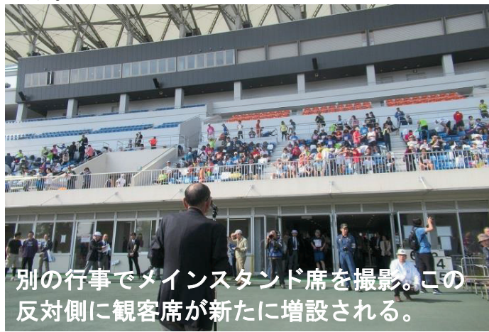
別の行事でメインスタンド席を撮影。この反対側に観客席が新たに増設される。

もちろん、すでにスタジアムの観客席の増設は予定されたものになっており、様々に進行しているものですが、多額の税の使途に当たっては、あくまで多数の事業のバランスと透明性が配慮されるべきものだと思います。