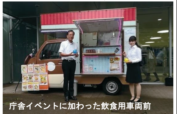
庁舎イベントに加わった飲食用車両前

近年忘れられた言葉に、行政の簡素化、あるいは行政のスリム化という行政改革の観点があります。行政事業の執行費用や職員の給与の全てが住民の税金を基本に成り立っていることであり、いかに支出を減らすか、無駄な事業を整理するか、その視点を行政職員が持つ必要があると思います。