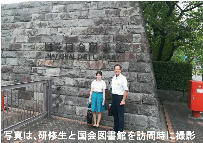
写真は、研修生と国会図書館を訪問時に撮影

ただし、町田市の場合は、そのいずれにも目指しておらず、一般市に留まる考えを持ってきました。そのため、町田市には児童相談所がありませんが、「政令市」、あるいは「中核市」に昇格することが必須要件となっていることが、今回の一般質問で再確認できました。