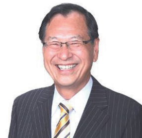
充実した議会活動