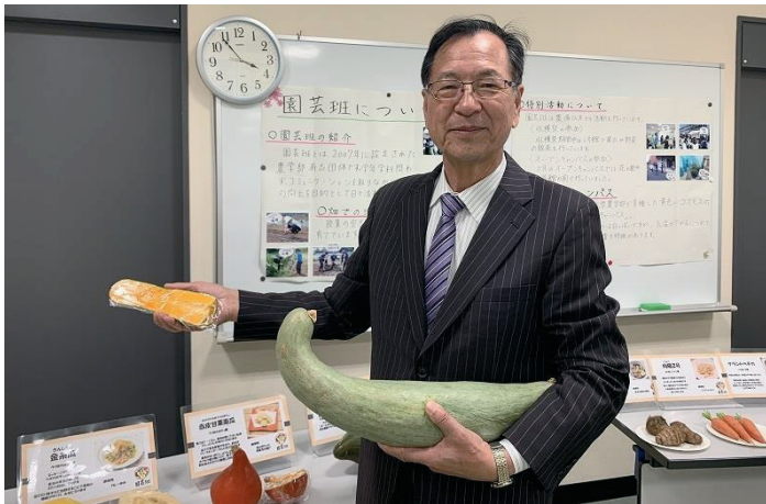
全て、玉川大学農学部園芸班が育てた作物

そうした幅広い見地に立つならば、町田市は「地産地消」という旧来の狭い考えから解放され、地元産品を地元業者が流通に介在して、「全国に販売する」＝「地産地商」という発想に転換し、農業をとらえ返す状況に直面していると考えています。