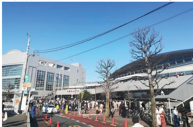
昨年赤十字奉仕団で新成人に検血呼び掛け

当日は、会場の1Fロビーで町田赤十字奉仕団による、献血呼びかけを毎年行っています。私が議長時代には、過去2回とも舞台上から新成人に挨拶を送りましたが、昨年からのこの運動に参加しています。もちろん、この日に献血を求めるのではなく、献血の啓発活動を行っているものです。新成人の皆さんは、機会を見て献血にご協力ください。