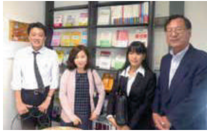
教育系出版社訪問