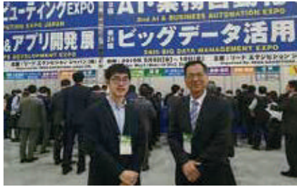
東京ビックサイトで展示会見学