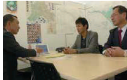
行政の幹部と面談した様子