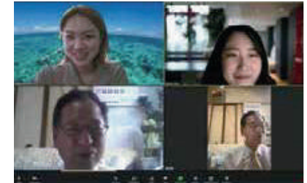
先輩インターン生とzoomで気軽に面談