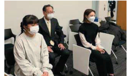
市議会委員会傍聴の様子