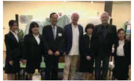
演奏を終えた演奏家らとの記念撮影