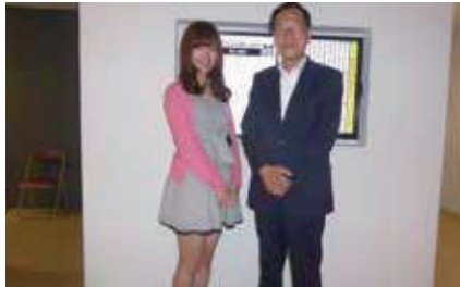
議員出席表示版前