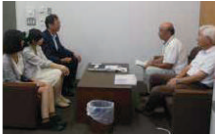
請願者と紹介議員として懇談会