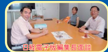
日経電子版編集長面談