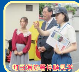
町田消防署体験見学